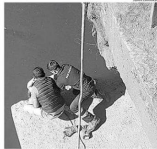
EL PARAMÉDICO BAJÓ HASTA UN PILAR DEL PUENTE EN UNA CUERDA.

"Lo hice porque sentí que era mi deber, como paramédico y como persona", dijo el joven que desde hace cinco años es bombero de la Octava Compañía de Temuco.