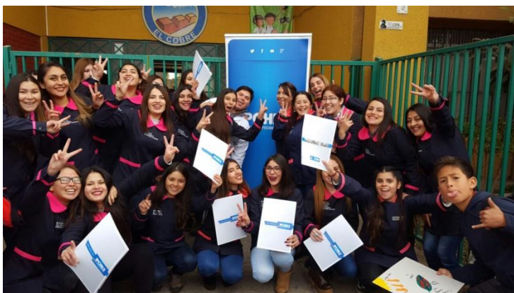
Estudiantes de IPCHILE que participan en Programa A+S

LINEA: VcM Social PROGRAMA: A+S SEDE: Rancagua