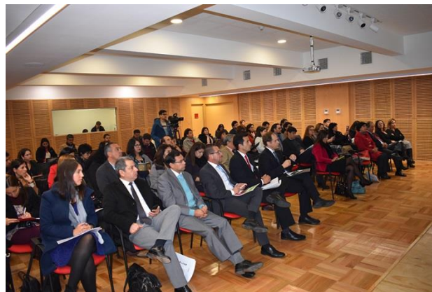
Representante de Instituciones