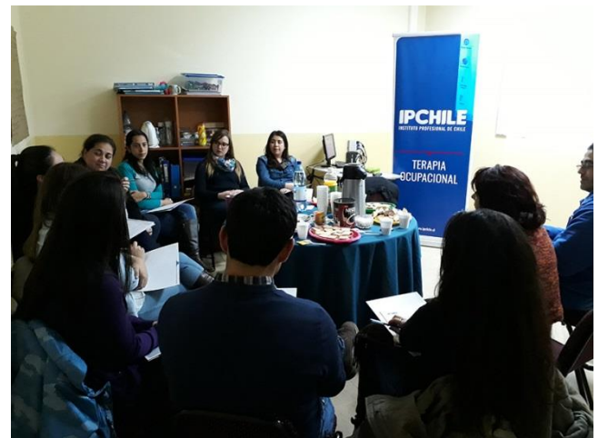
Docentes de Terapia Ocupacional