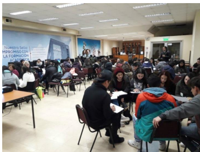
Estudiantes y docentes en charla de inclusión

Finalmente señalar que, esta Charla potencia el enfoque inclusivo que tiene el instituto profesional IPCHILE, además de favorecer la conciencia social.