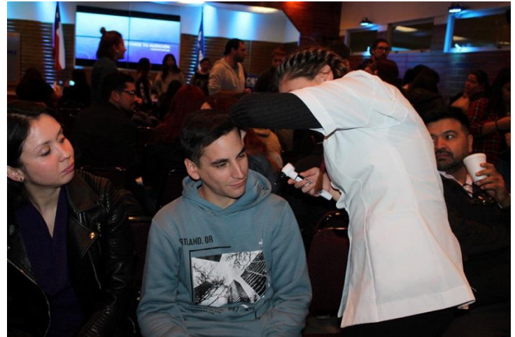
Estudiantes de Fonoaudiología en operativo

Esta actividad reunió a estudiantes y docentes de la carrera en un espacio de reflexión y conversación de temas relevantes para el quehacer fonoaudiológico en el área de la audición.