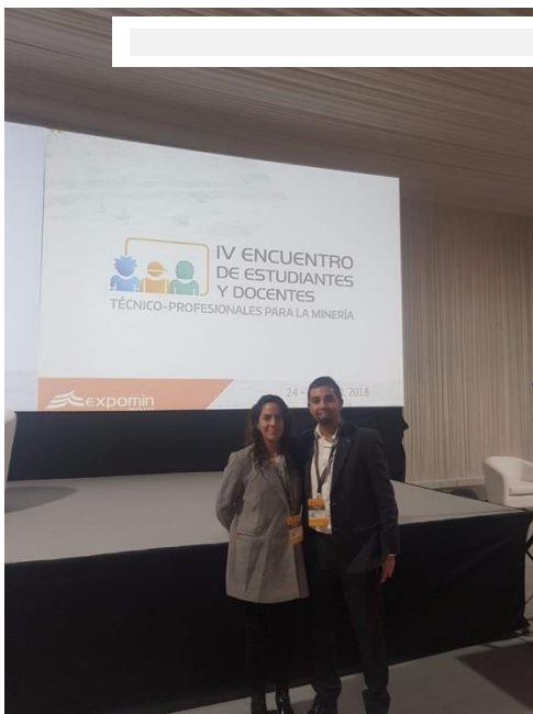
Participantes CONSORCIO Escuela Minería

LINEA: VcM Disciplinar PROGRAMA: Educación Continua SEDE: República