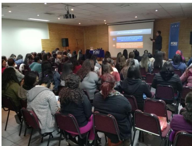
Estudiantes IPCHILE en charla de neurociencias para el aprendizaje

LÍNEA: VcM Disciplinar PROGRAMA: Educación Continua SEDE: San Joaquín