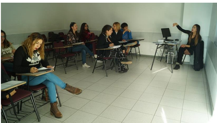
Delegados en actividad de capacitación

LINEA: VcM Comunidad Interna PROGRAMA: Capacitación Delegados SEDE: Rancagua