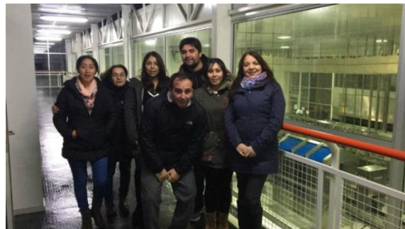
Estudiantes de IPCHILE Vistan Planta Coca Cola