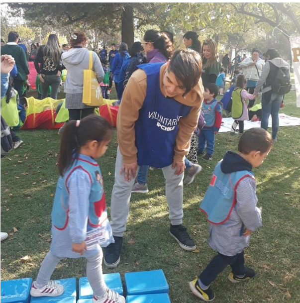
Estudiantes de IPCHILE participan en Voluntariado

LINEA: VcM Social PROGRAMA: Voluntariado SEDE: República