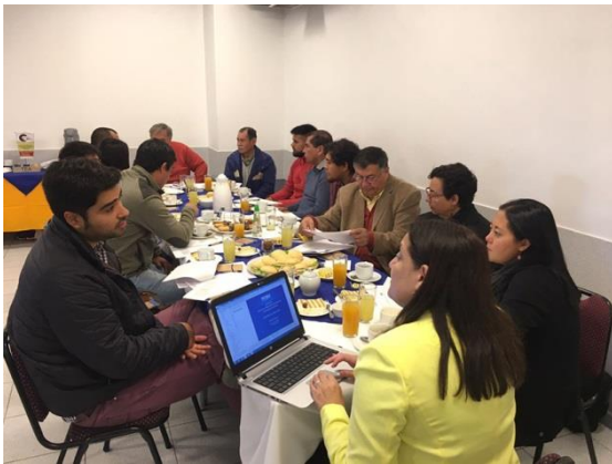
Participantes Mesa Técnica

El objetivo general del Consorcio “Desafíos de la industria” es establecer relaciones colaborativas con sectores productivos y sociales, que permitan generar información de valor para los procesos de evaluación y pertinencia de la oferta formativa institucional, para lo cual se formaron mesas disciplinares de trabajo relacionadas a las áreas de Minería y Prevención, los participantes tuvieron la oportunidad de intercambiar opiniones en relación a temas determinados en donde se generó una rica interacción entre los distintos participantes. Egresados contaron sus experiencias, los estudiantes expusieron sus inquietudes y los representantes de la industria indicaron que se necesitan saber los futuros trabajadores