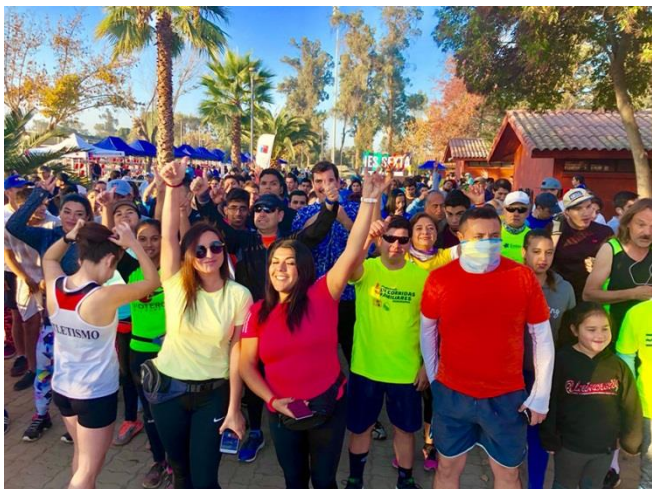
Participantes Segunda Corrida IES SEXTA

LINEA: VcM Social PROGRAMA: Socialización SEDE: Rancagua