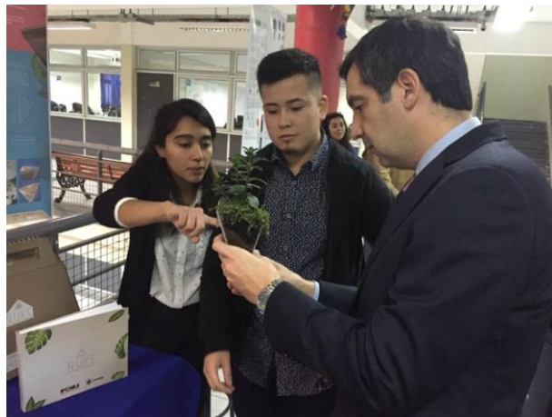
Vicerrector de Sede República recorriendo la feria

La Feria de Proyectos de Diseño se desarrolló el día Lunes 28 de Mayo en Sede República. En esta actividad se presentaron y dieron a conocer 10 proyectos de Diseño e Innovación desarrollados por los estudiantes de la Carrera que se encuentran en proceso de titulación. Durante la jornada los estudiantes dieron a conocer sus proyectos, como estos fueron realizados y concebidos de manera conceptual y proyectándolos a través de procesos de prototipado y fabricación en materiales como madera, metal, polímeros entre otros. La exposición de proyectos es una instancia propuesta por la Carrera de Diseño de IPCHILE para dar a conocer el trabajo de los estudiantes a la comunidad y que estos sean participe del proceso de formación final de los estudiantes expositores.