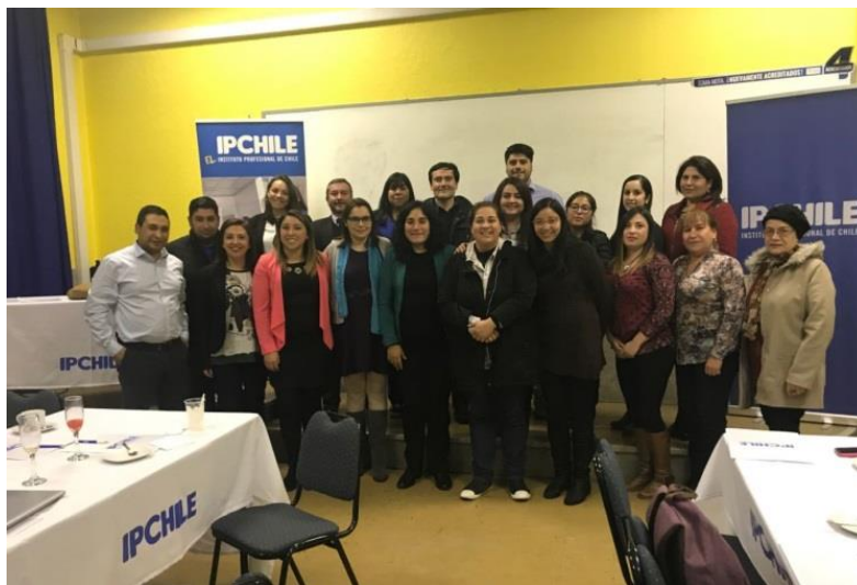
Participantes Consorcio Escuela de Salud

En este primer consorcio se abordó la “Valoración de las actividades en campos clínicos” para ello la metodología el trabajo se desarrolló por cada una de las carreras, para obtener información pertinente a la diversidad de campos clínicos. Esta actividad fue altamente valorada por los participantes.