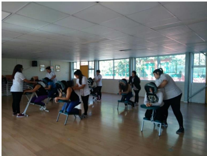
Estudiantes de Masoterapia en Colegio Frankfort

LÍNEA: VcM Social PROGRAMA: Servicios a la Comunidad SEDE: San Joaquín