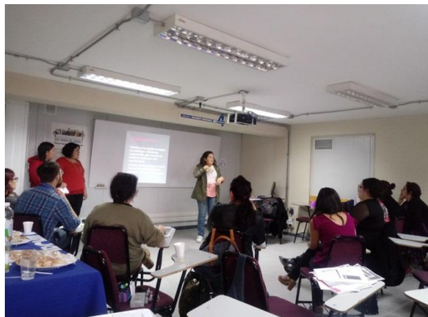
Docentes IPCHILE en taller de perfeccionamiento

Esta instancia, así como es resto de los cursos base que se desarrollarán en la sede durante el primer semestre, es parte de la política de perfeccionamiento permanente hacia los docentes, que busca promover de manera permanente y progresiva la reflexión pedagógica y la innovación al interior del aula.