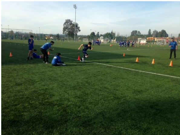
Participantes programa A+S

LINEA: VcM Social PROGRAMA: A+S SEDE: Temuco