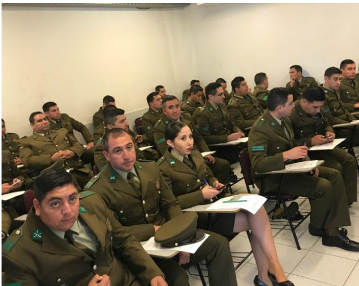
Carabineros Rindiendo Examen para Ingresar Escuela Suboficiales

LÍNEA: VcM Social PROGRAMA: Servicio a la Comunidad SEDE: Rancagua