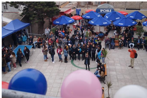
Estudiantes IPCHILE en el día de la voz

Con el objetivo de fomentar el uso adecuado y el cuidado de la voz se realizó una intervención en el Patio Central de Sede La Serena para concienciar a los estudiantes, cuerpo docente, administrativos y autoridades sobre esta valiosa materia. Con una muestra artística en la que docentes y estudiantes de la Carrera de Fonoaudiología de la Sede presentaron una mezcla de canciones populares de música chilena en los últimos 60 años, se realizó esta intervención en el marco de la Conmemoración del “Día Mundial de la Voz”. Esta actividad se enmarcó dentro de la Semana de la Voz, en la que se brinda atención fonoaudiológica gratuita a todas las personas con sintomatología vocal o a quienes, simplemente, quieran conocer el estado de su aparato fonador. Además, instar a la gente a entrenar su voz si es que van a trabajar con ella y así evitar sufrir daños. Los objetivos generales que persigue esta instancia son diversos, y entre ellos algunos de gran relevancia, como por ejemplo educar a la población sobre la