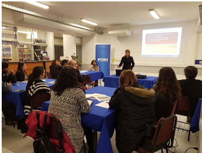
Mesas Técnicas Consorcio Humanidades

El espíritu de esta actividad es continuar conformando estos consorcios con diferentes temáticas que fomenten aún más el bienestar de las necesidades educativas de la región, comuna e instituciones.