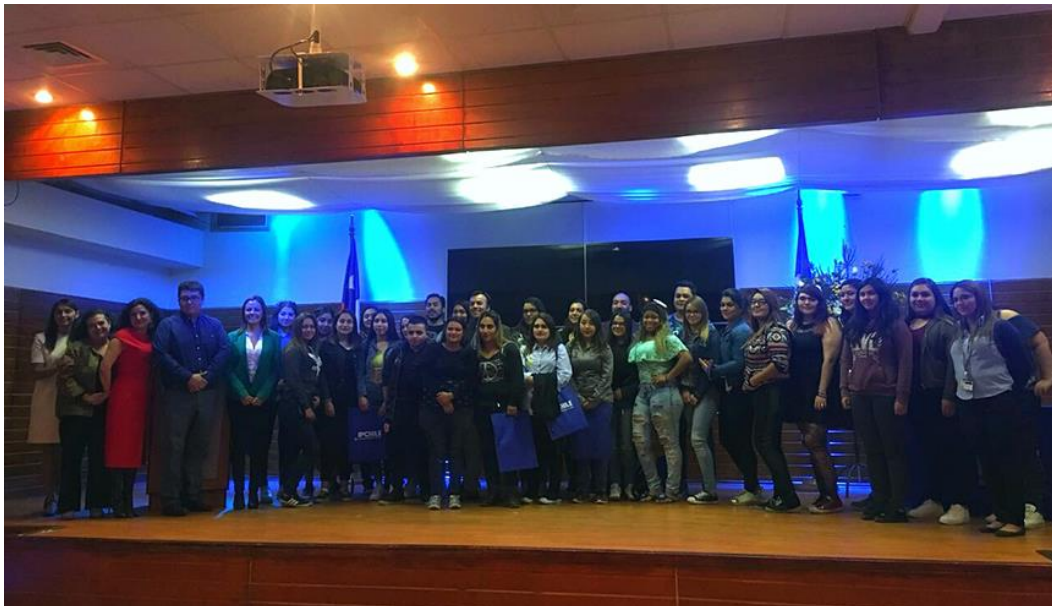
Estudiantes y Egresados