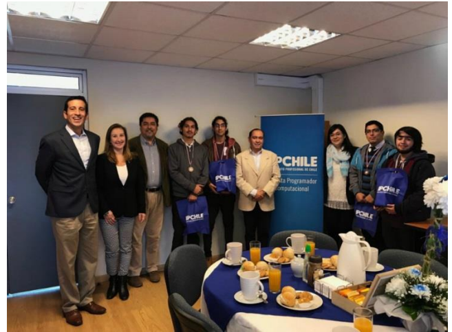
Autoridades IPCHILE y estudiantes premiados