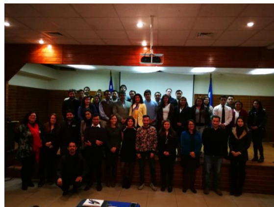
Participantes Consorcio Administración y Negocios

El Consorcio de la Escuela de Administración y Negocios se desarrolló como una mesa técnica de trabajo en que los invitados a participar, Empleadores, Egresados, Estudiantes y Docentes, expusieron las necesidades de actualización de competencias y conocimientos para las distintas industrias involucradas: Diseño – Publicidad – Producción de Eventos; auditoría y Administración de Empresas; Gastronomía – Turismo. Dentro de las acciones que la institución y la escuela han definido para su desarrollo, se ha incorporado la consulta a medios productivos, quienes en una mesa técnica de trabajo, en conjunto con docentes, egresados y alumnos de las distintas carreras de la escuela de administración y negocios, analizaron las competencias que el mercado laboral valora en los nuevos profesionales, dados los cambios en los procesos productivos, evolución tecnológica y mejoras en las industrias en que se incorporan. Para la Escuela de Administración y Negocios es muy satisfactorio contar con el compromiso que los docentes, estudiantes y directores de carrera muestran al asistir a componer las mesas técnicas con empleadores en que se analizan temas que impactan el desarrollo formativo de las carreras que imparte la escuela.