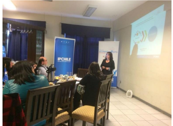
Orientadores Plan Acompañamiento

La actividad finalizó con una sesión de masajes para los respectivos invitados, masajes que fueron ejecutados por la carrera de TNS en Masoterapia.