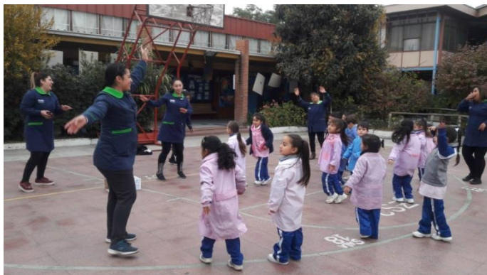
Estudiantes IPCHILE en Colegio Los Conquistadores

LINEA: VcM Social PROGRAMA: Servicios a la Comunidad SEDE: San Joaquín