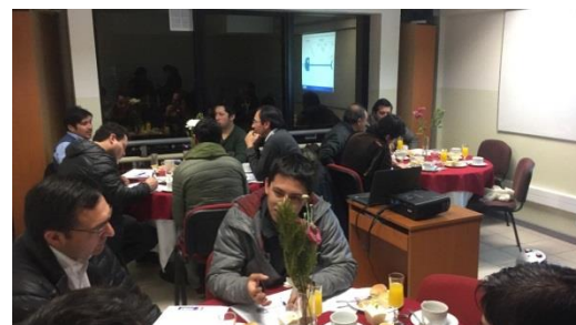
Mesa Técnica Consorcios Escuela Ingeniería