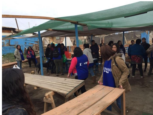
Estudiantes de IPCHILE en voluntariado

A modo de generar un espacio de cercanía, se realiza en primera instancia un desayuno en la sede del campamento, además de actividades lúdicas de entretenimiento para los niños, como disfraces y juegos. Posteriormente y a modo de contribuir en el desarrollo de las familias pertenecientes a un sector de alta vulnerabilidad, los estudiantes se distribuyen en los distintos hogares para aplicar sus instrumentos de recolección de información, que le permitirán posteriormente elevar conclusiones del diagnóstico preliminar.