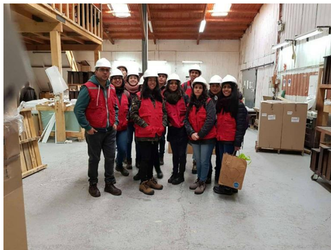
Estudiantes de Prevención de Riesgos en Empresa Magasa