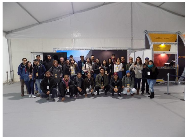
Estudiantes IPCHILE en EXPOMIN