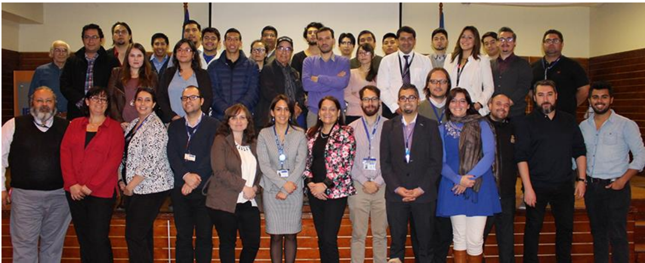
Participantes CONSORCIO Escuela Minería

El fin de este consorcio era establecer mesas de conversación por área y discutir sobre innovación tecnológica en estos sectores productivos, qué es lo que espera la industria de los futuros profesionales para establecer relaciones laborales. En esta ocasión, también participó sede San Joaquín, con invitados que representan el parecer y la visión objetiva de la carrera de construcción.