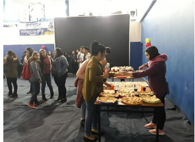
Estudiantes primer año Carrera Terapia Ocupacional

Esta bienvenida aporta para que se establezcan relaciones entre compañeros, docentes y dirección de carrera, lo cual se da con la finalización de la convivencia.