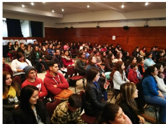
Asistentes a la Charla

La Ministra del Servicio Nacional de la Mujer, señora Carolina Schmidt, lanzó la campaña “No + violencia en el pololeo” a raíz de los altos indicadores en violencia física y psicológica entre los jóvenes. Este es el principal argumento para intervenir y facilitar el cambio de conducta. Para la Dirección de Asuntos Estudiantiles (DAE) es muy importante plantear temáticas que se encuentran en la contingencia y que no son ajenas a nuestros estudiantes, esto nos permite generar conciencia y generar instancias de dialogo.