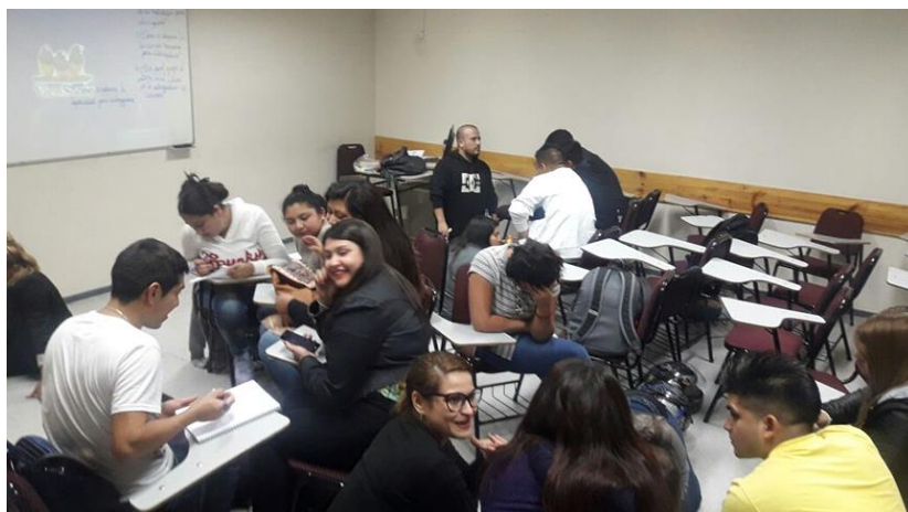
Estudiantes IPCHILE en talleres de autogestión