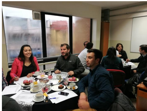
Participantes Consorcio Escuela de Minería