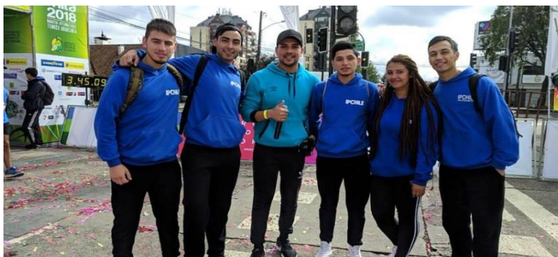
Participantes IPCHILE en organización Maratón Internacional Temuco Araucanía (MITA 2018)