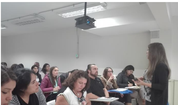
Inducción docentes nuevos Sede TEMUCO

Además se les dio a conocer las instancias de perfeccionamiento docente que entrega la institución y las características de apoyo a su labor por parte de los asesores pedagógicos.