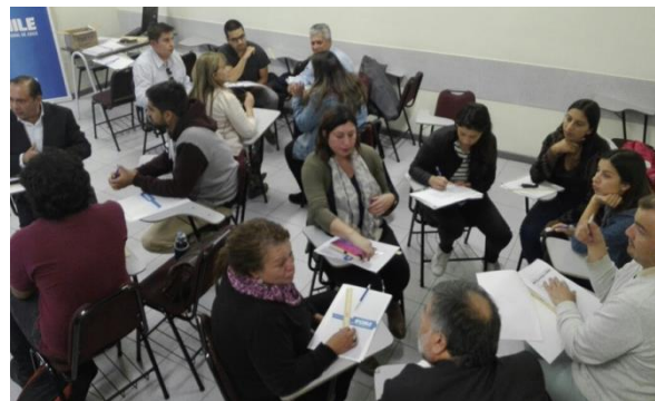
Inducción docentes nuevos Sede LA SERENA